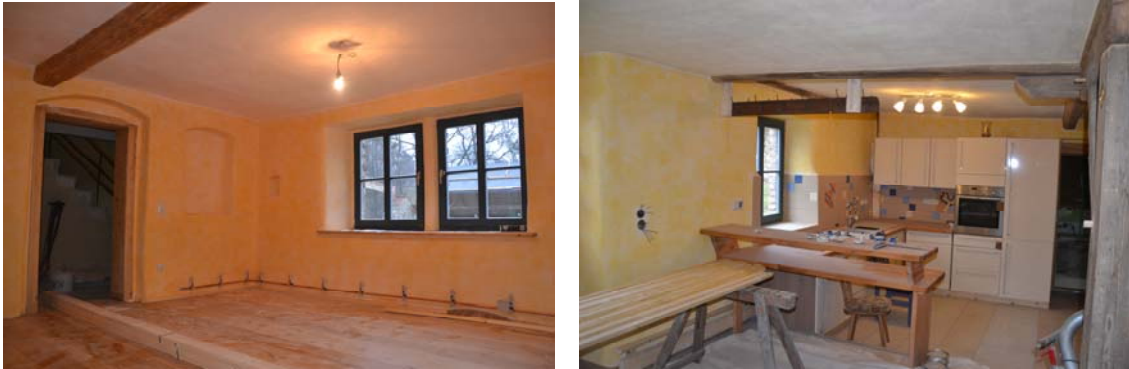
Abb.: Innenansicht Wohnhaus, links Wohnzimmer, rechts Küche