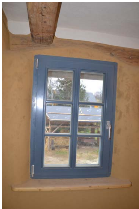
Abb.: Innenansicht Wohnhaus, links Flur OG, rechts Fensteransicht OG