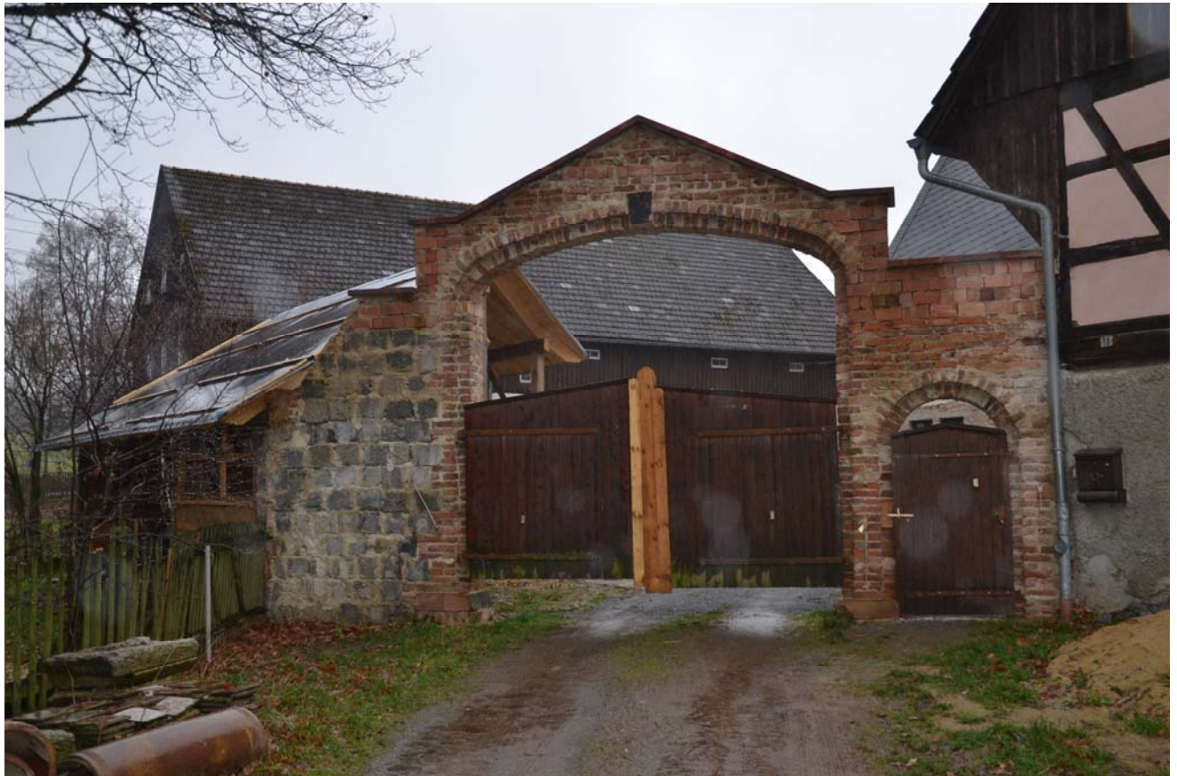
Abb.: Rosenhof – Ansicht Toreinfahrt Herbst 2016 (aus Richtung Norden)

Die Sanierungsarbeiten am Wohnhaus wurden nach der Winterpause im Frühjahr 2016 weitergeführt und können wie folgt zusammengefasst werden: