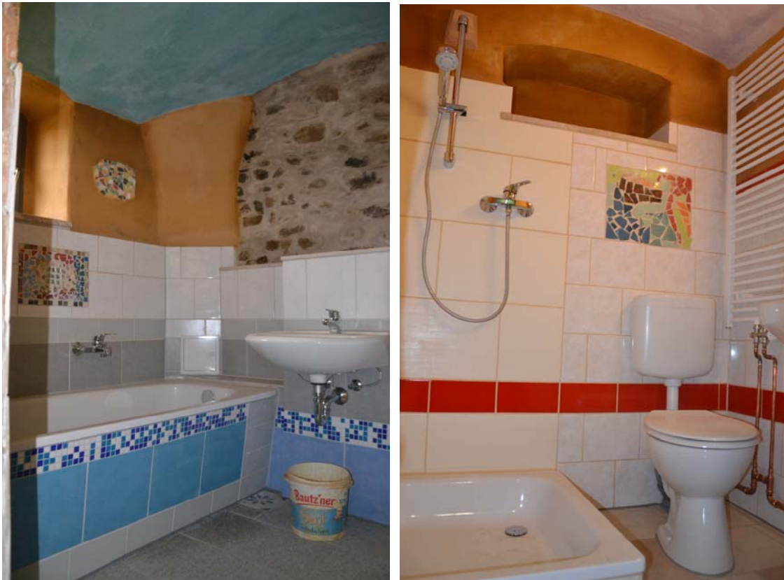
Abb.: Innenansicht Wohnhaus, Bäder im Erdgeschoss

Bis Ende 2016 sind folgende Restarbeiten geplant: