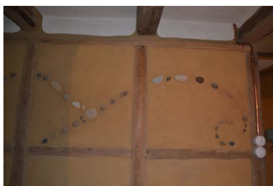
Abb.: Innenansicht Wohnhaus, Details Flur OG

Die Fortsetzung der Bautätigkeit für Freiwillige im Bausommercamp war dieses Jahr besonders intensiv und umfangreich. Die Projektstage mit einer Schulklasse im Rahmen einer Bauepoche ist als wesentliche Geburtsstunde der Remise am Hofeingang zu nennen, die zudem durch das Staatsministerium für Kultus mittels einer Prämie gefördert wurde.